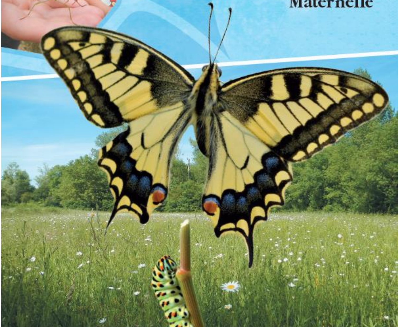
Chenille et papillon Machaon