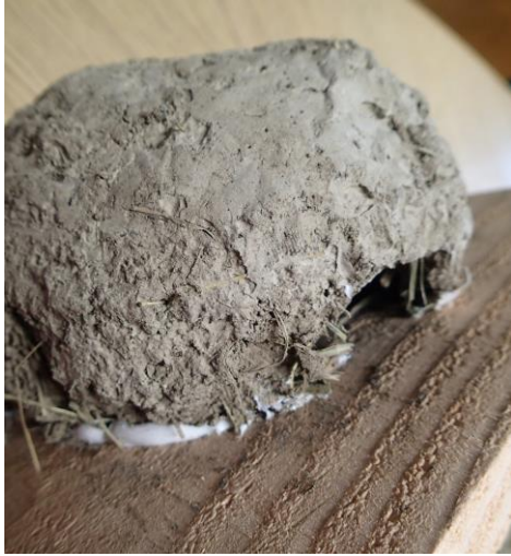
Nid hirondelle de fenêtre

A l'aide de mastic, fixer le nid sur une planche de bois.