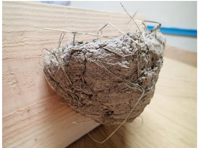
Nid hirondelle rustique